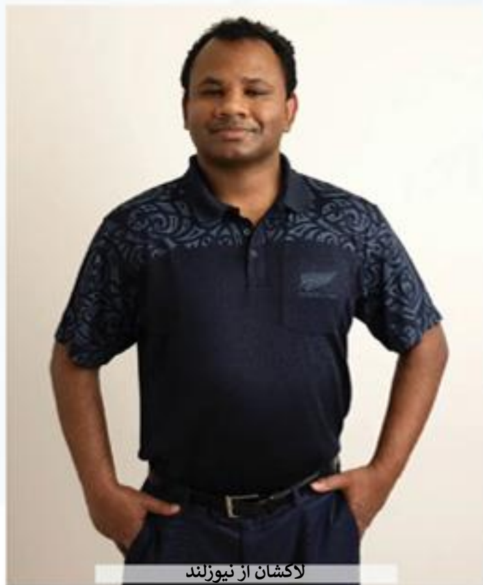
لاکشان از نیوزلند

«الان خیلی خوشحالم. من واقعا آزادم! من از خدا و پستر کریس به خاطر خدمت شفا بخش ویژه اش که زندگی من را برای همیشه بازسازی کرد و تغییر داد، سپاسگزارم.»