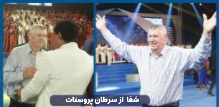
شفا از سرطان پروستات

خادمین ارشد و شهادت دهندگان، گزارش‌های تاثیرگذار و شهادت‌های بی‌نظیری را به اشتراک گذاشتند. بسیاری از دسترسی گسترده مینستری شفای پستر کریس و از قدرت نامحدود و فیض دوست داشتنی خدا حیرت زده می‌شدند.