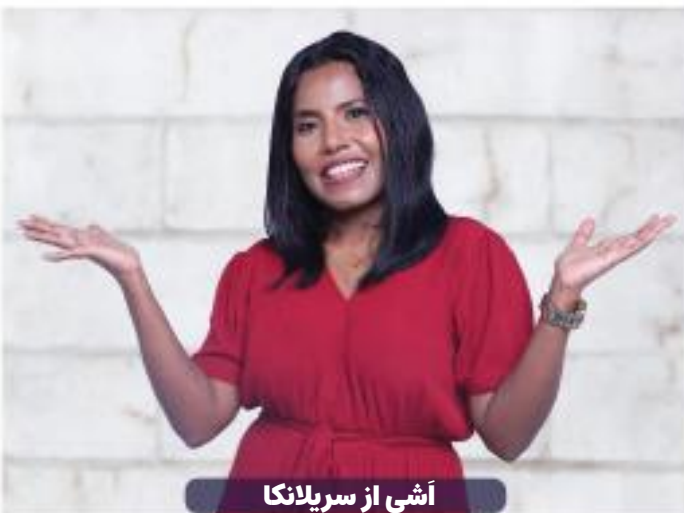
آشی از سریلانکا

کاملاً خوب شد. امروز، او یک زن کاملاً جدید و زیبا است که لبخند و تعادل خود را بازیافته است. او می‌تواند راه برود و بدود، و ناشنوایی‌اش هم از بین رفته است!