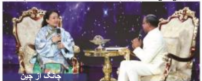
چانگ از چین

ایشان گفتند: «به خدمت شفای زنده شفای جاری با پستر کریس خوش‌آمدید. در اینجا، همه محدودیت‌ها برداشته شده است. امروز شفا به سراغ هرکسی که بیمار است، می‌آید. هیچ‌کس از انتظاراتش کوتاه نخواهد آمد زیرا قدرت خدا هر کجا که باشید شما را تحت تأثیر قرار می‌دهد. در قلمرو روح هیچ فاصله‌ای وجود ندارد. درحالی‌که مرد خدا سخن می‌گویند،