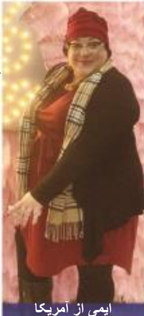
ایمی از آمریکا

برای به اشتراک گذاشتن شهادت‌های خود از خدمت شفای زنده شفای جاری با پستر کریس، لطفاً یک ایمیل به testimonies@healingstreams.tv ارسال کنید یا با هر یک از شماره‌های صفحه پشتی تماس بگیرید. لحظه‌ها و معجزات شگفت‌انگیز بیشتری را با تماشای شهادت‌های شفای جاری به صورت زنده در تلویزیون شفای جاری www.healingstreams.tv دوباره تجربه کنید.