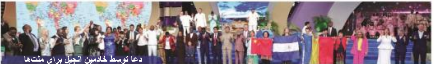
دعا توسط خادمین انجیل برای ملت‌ها

مرد خدا در میان شادی و جشن‌ها، برای خانواده‌ها، ملت‌ها و رهبران دعای صمیمانه‌ای کردند و صلح و سعادت جهانیان را خواستار شد. ایشان همچنین کسانی را که نجات را دریافت نکرده بودند، فراخواندند و با دعای کوتاهی آنها را راهنمایی کردند تا عیسی را به عنوان خداوند خود بپذیرند.