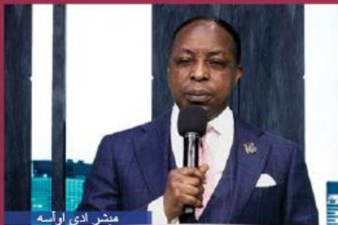
مبشر ادی اوآسه

این فصل دیگری از جشن و شکرگزاری است زیرا ما همچنان به مستحکم کردن دستاوردهای خود از شفای جاری ادامه می‌دهیم. سمینار جهانی بعدی معجزه ایمان را از دست ندهید. این سمینار فرصت بزرگی خواهد بود تا پیروزی‌های خود را از دوره دهم خدمت شفای زنده بازگو کنیم.