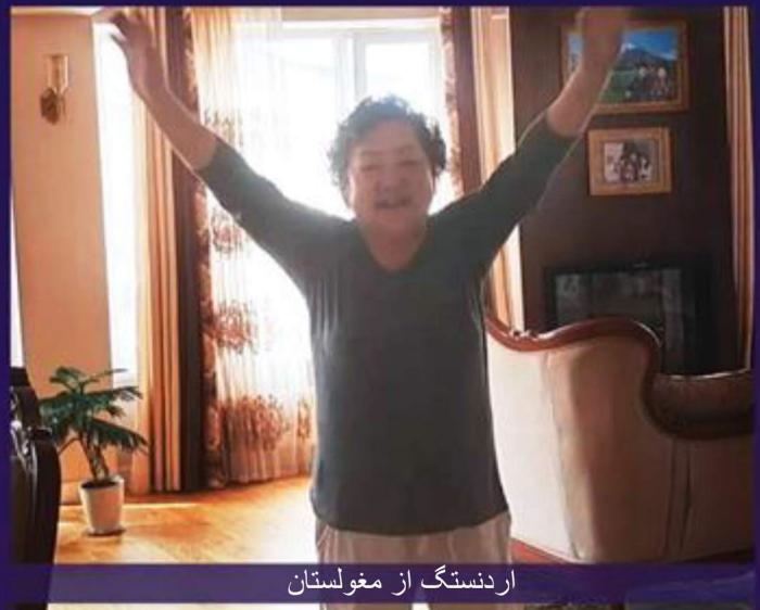
اردنستگ از مغولستان

اردنستگ از مغولستان با مشکلات جسمی متعددی روبرو بود. امتحان سخت او در سال ۲۰۱۳ با خستگی دائم، کاهش وزن شدید و احساس سوزن سوزن شدن آغاز شد. در بیمارستان تشخیص دادند او دچار دیابت شده است. او در طول چند سال اخیر، به نارسایی قلبی، نارسایی مزمن کلیه و فشار خون بالا نیز مبتلا شد. عوارض متعدد بیماری بدنش را ضعیف کرد و راه رفتن، بلند کردن دستان یا هر کار دیگری را برایش غیر ممکن کرده بود. اردنستگ در مورد خدمت شفای آنلاین شفای جاری شنید و برای شرکت در آن ثبت نام کرد. این جلسه ویژه، عاملی بود که برای تغییر وضعیت او لازم بود.