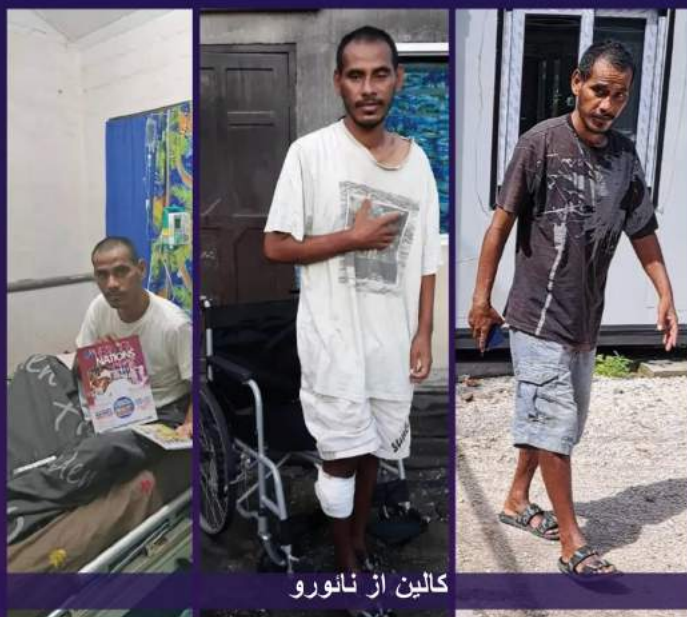
کالین از نائورو

هنگامی که مرد خدا پستر کریس وارد شدند و شروع به دعا برای بیماران و رنج کشیدگان کردند، افراد زیادی آماده و مشتاق بودند. مرد خدا پر از روح القدس با فرمانی مقتدرانه در نام عیسی به تمام بیماریها، چه شناخته شده باشند و چه ناشناخته نهیب زدند. صرفنظر از زمان و مکان، هیچ مانعی در برابر سرازیر شدن قدرت خدا برای ارتباط برقرار کردن با زندگی‌ها و تغییر دادن شرایط در یک لحظه وجود ندارد.