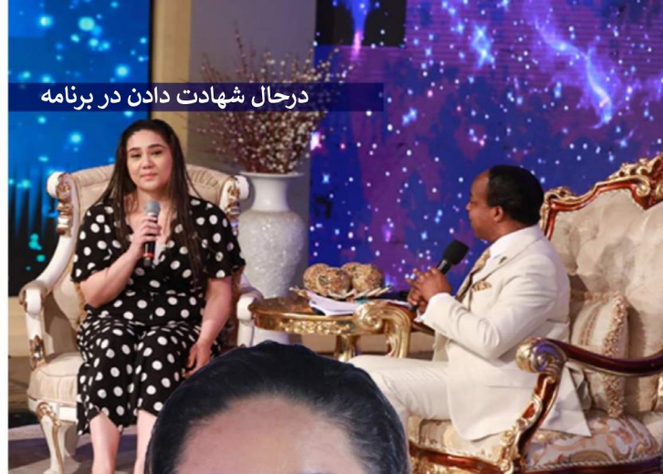
در حال شهادت دادن در برنامه

او تجربه‌اش را اینگونه توصیف می‌کند: «وقتی پستر کریس رسیدند، درحالی‌که با هیجان لحظه معجزه‌ام را می‌دیدم، ایمانم قوت گرفت. وقتی ایشان شروع به خدمت به شرکت کنندگان از سراسر جهان کردند، شفایم را دریافت کردم و خدا را برای اینکه من را لمس کرد و قوت و حیات را به بدنم برگرداند، شکر کردم. من آزاد شده‌ام، از درد و هر موقعیتی که من را محدود کرده بود، رها شده‌ام.