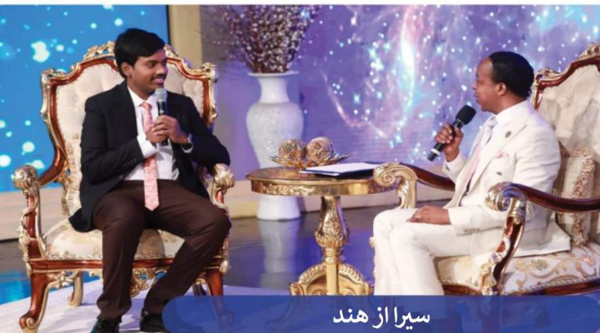
سیرا از هند

آخر هفته‌ای باورنکردنی از شفای الهی و شگفتی‌های الهام‌بخش، مردم را از جاهای مختلف و از سراسر کشورهای دنیا به برنامه آنلاین خدمت شفای جاری با پستر کریس در جولای ۲۰۲۳ کشاند. میلیاردها شرکت کننده شاهد عملی شدن کلام خدا در زندگی‌هایشان بودند و آن را تجربه کردند.