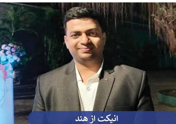
انیکت از هند