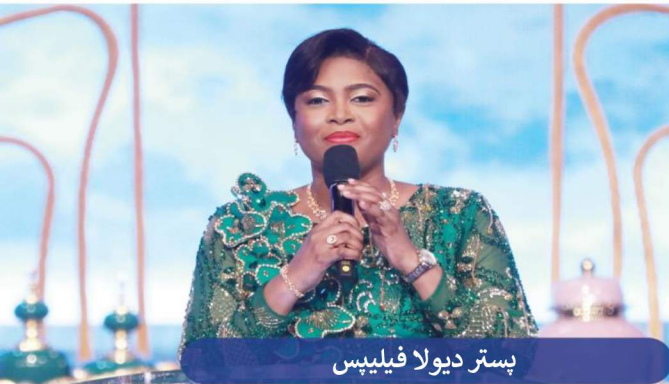
پستر دیولا فیلیپس