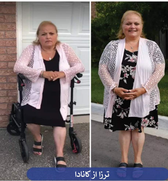
ترزا از کانادا