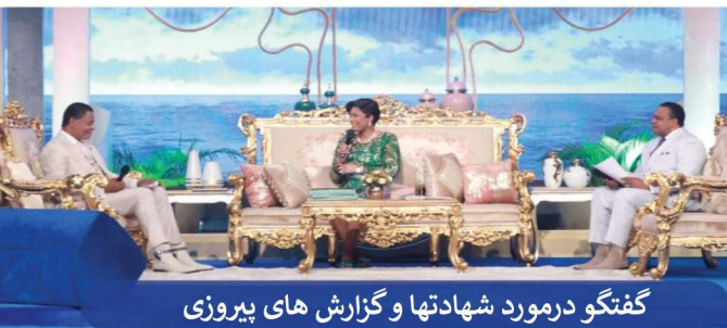
گفتگو درمورد شهادتها و گزارش های پیروزی