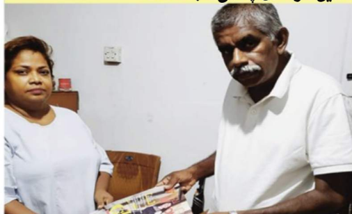
آنیل در حال بخش مجله شفا

« وقتی دکترم نتیجه آزمایشها را دید، از اتفاقی که در زندگی من افتاده بود، شگفت زده شد. دکتر سلامت من را اعلام کرد و تمام وقتهای جراحی را کنسل کرد. من شهادت شفایم را با او به اشتراک گذاشتم و گفتم که چگونه مجله شفای امته‌ها وسیله‌ای بود که خدا از آن برای تغییر دادن شرایطم استفاده کرد.»